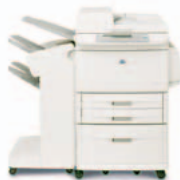
HP LaserJet 9040/9050mfp avec bac d'empilement

Chaque casier peut être affecté à un individu, un groupe de travail ou un service pour une récupération aisée des tâches. La sortie peut également être configurée comme une trieuse, un bac d'empilement et un séparateur de tâches.