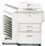
HP LaserJet 9040/9050mfp avec la sortie 8 casiers

Cordon d'alimentation, cartouche d'impression, documentation de l'imprimante, logiciels d'impression sur CD-ROM, cache pour le panneau de commande, deux bacs d'alimentation standard de 500 feuilles, bac universel de 100 feuilles, bac d'alimentation de 2 000 feuilles, choix de gestion de sortie du papier, accessoire d'impression recto verso automatique (préinstallé), serveur d'impression embarqué HP Jetdirect, chargeur automatique de documents.