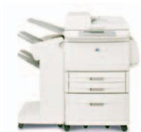
HP LaserJet 9050mfp avec bac d'empilement optionnel

Départements des grandes entreprises et services polyvalents des entreprises de moyenne taille, avec des groupes de travail de 30 à 50 personnes ayant besoin d'un accès réseau convivial, rapide et économique à l'impression et la copie noir et blanc jusqu'en A3, à la numérisation couleur, ainsi qu'à une gamme d'options de télécopie, de finition et de communication numérique pour une efficacité accrue, une productivité améliorée et un flux de travail rationalisé.