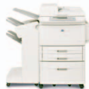
HP LaserJet 9040/9050mfp avec bac d'empilement et agrafeuse

Empile jusqu'à 3 000 feuilles de papier avec décalage des tâches.