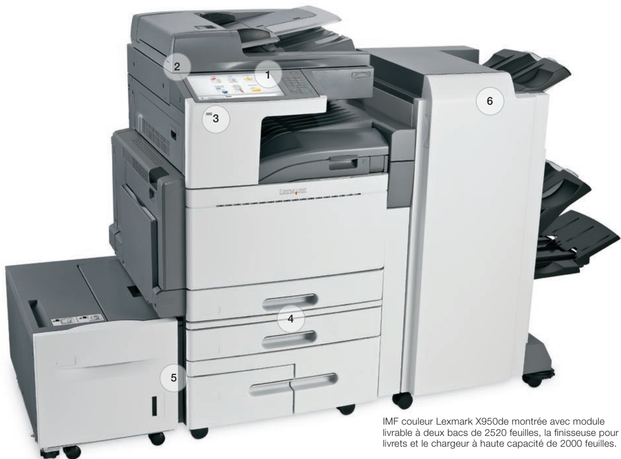
IMF couleur Lexmark X950de montrée avec module livrable à deux bacs de 2520 feuilles, la finisseuse pour livrets et le chargeur à haute capacité de 2000 feuilles.